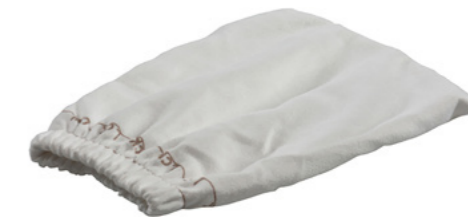
Gant de nettoyage Staub-Fix