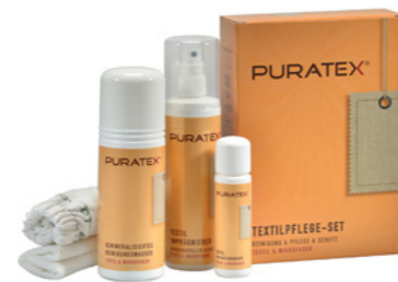
kit de nettoyage pour textiles