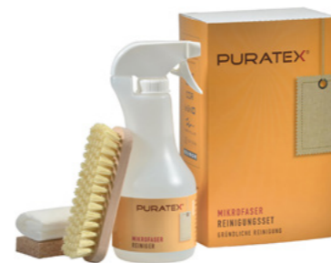
kit de nettoyage microfibre