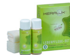
Kit d'entretien du cuir O