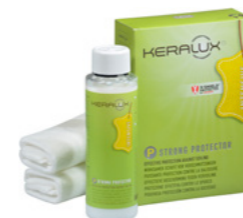
Protection intensive P