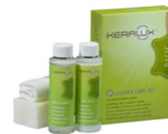
Kit d'entretien du cuir P