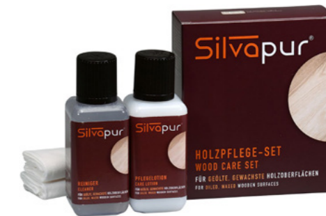
Kit d'entretien pour bois