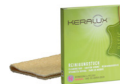
Chiffon de nettoyage N