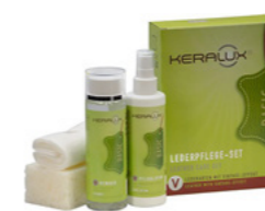
Kit d'entretien du cuir V