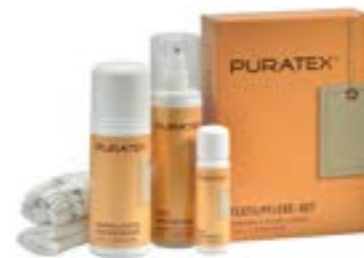
Kit per la cura dei tessuti