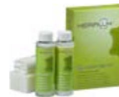
Kit P per la cura della pelle