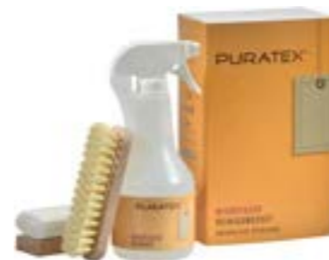
Kit per pulizia di microfibra