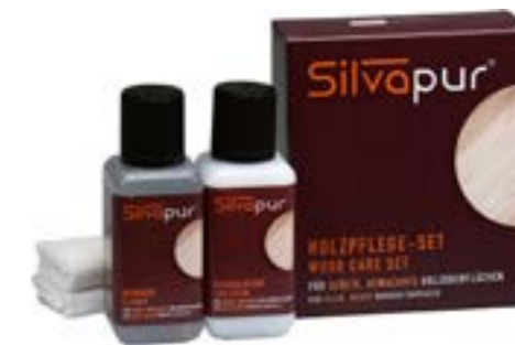
Kit per la cura del legno