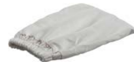
Guanto per pulizia Staub-Fix