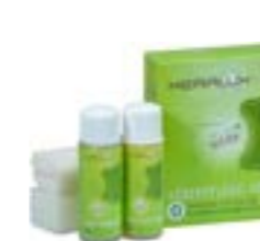
Kit O per la cura della pelle