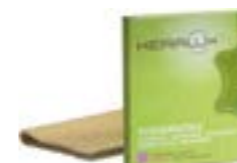
Panno per pulizia N