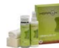
Kit V per la cura della pelle